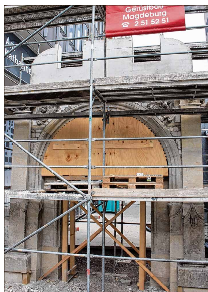
Aktuelle Ansicht vom Katharinenportal.