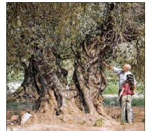
Mit „Der Olivenbaum“ werden Spenden für den Erhalt echter Bäume gesammelt.

Im Film versucht Alma den alten Olivenbaum ihres Großvaters von einem Energiekonzern wiederzubeschaffen.