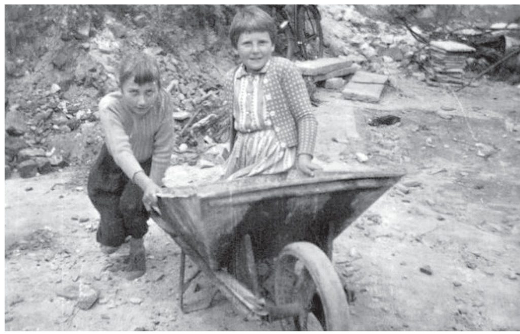
Wer erkennt sich auf den Fotos von der Entrümmung der Katharinenkirche?