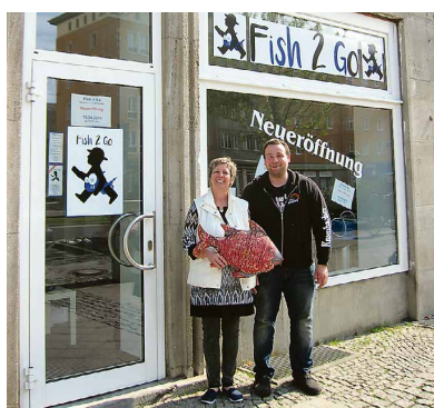
Die letzten Vorbereitungen für die Neueröffnung sind in vollem Gang.

Ab Montag, 18.04.2016, bereichert Fish 2 Go die Magdeburger Innenstadt mit Leckereien zum Mitnehmen.