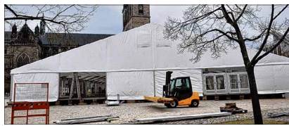
Ein Großzelt ist auf dem Domplatz aufgebaut worden.

Travel Mart um eine geschlossene Veranstaltung handelt, können Magdeburger übrigens nicht ins Zelt. Das entspricht der langjährigen Vorgehensweise der Deutschen Tourismuszentrale. Sie möchte damit erreichen, dass sich die Teilnehmer der Veranstaltung voll und ganz auf das dicht gepackte Programm und auf die geschäftlichen Gespräche