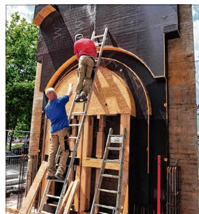
Bauarbeiter bereiten die Verschalung für die Stützwand vor.