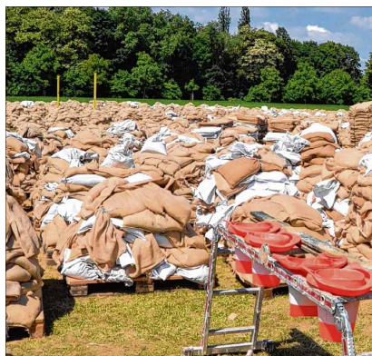
Bei der Hochwasserkatastrophe 2013 wurde kurzhand der Pechauer Sportplatz zur Einsatzzentrale. Durch den Einsatz von Großkraftfahrzeugen, Hubschraubern und die Füllung von Tausenden Sandsäcken für die Sicherung der ostelbischen Stadtteile und Ortschaften wurde die gesamte Sportanlage erheblich in Mitleidenschaft gezogen.

Im Falle eines Hochwassers in Magdeburg wird das Stadtgebiet in drei Einsatzbereiche gegliedert - Rothensee, Innenstadt und Ostelbien. Die Einsatzplanung für Pechau beinhaltet drei Unterabschnitte mit je einer Führungsstelle vor Ort, u. a. am Pechauer Siel und im Ortskern. Nach der Flutkatastrophe vom Juni 2013 richtet die Stadt ihre Hochwasserschutzmaßnahmen auf einen Pegel von maximal 7,80 Meter aus, also rund 30 Zentimeter höher als das Junihochwasser war. Bei den operativen Maßnahmen im Bereich Pechau